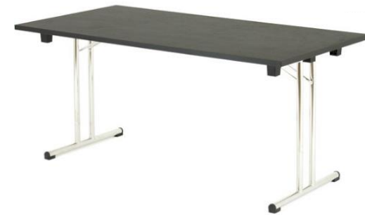
FLO.RENZ 160 x 80 cm