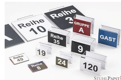
Reihennummerierung Klemme Klein