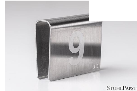
HAR.MONIE Nummerierung Klemme schmal